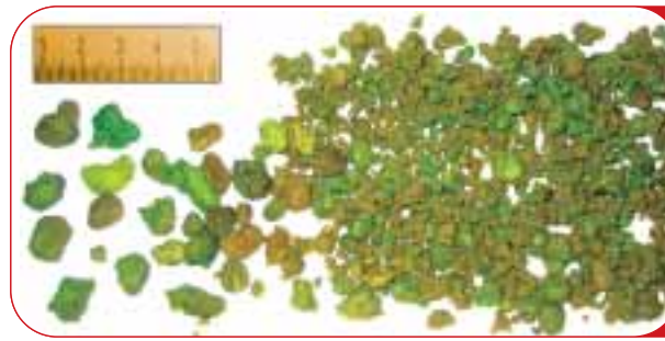
Ergebnis einer Leberreinigung: Rechts die kleinen Steinchen aus den Gallengängen der Leber, links die klassischen Gallenblasensteine

Leider wird die Tatsache, dass Lebergänge und Gallengänge verstopfen können, weitestgehend ignoriert. Warum? Weil man es eben nicht sehen kann. Weil man es mit bildgebenden Verfahren erst nachweisen kann, wenn die Steine eine