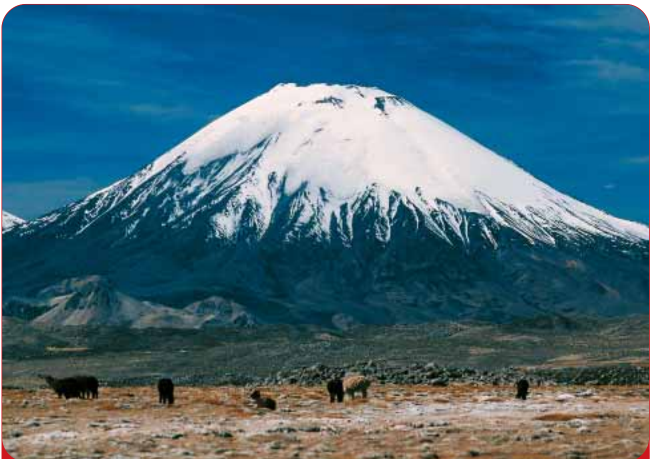
Vulkangestein – speziell bearbeitet, wird es als Medizinprodukt zur Giftausleitung angewendet

Ist die Verdauung gestört, tritt eine Kaskade von Begleiterscheinungen auf: unverdaute Nahrungsbestandteile fangen an, im Darm zu gären. Blähungen sind hier noch das kleinste Problem, denn es entstehen kurzkettenige Alkohole, sogenannte "Fuselalkohole", die genauso wie Äthanol (Trinkalkohol) durch die Leber abgebaut werden müssen. Man fühlt sich phasenweise wie "besoffen", "benebelt" und "betäubt", ohne etwas zu sich